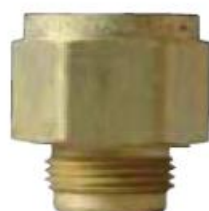
7572C-14A для перепускных клапанов