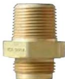
7572C-15A для шаровых и угловых клапанов